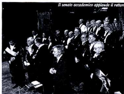
Il senato accademico applaude il rettore