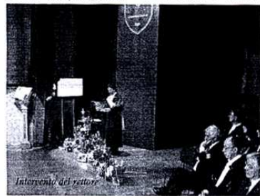
Intervento del rettore

la ricerca. Internamente abbiamo attivato una serie di procedure per fare autovalutazione e per monitorare le nostre attività. Questo ci permette di metabolizzare un processo più ampio di contesto a livello nazionale ed europeo guardandoci dal